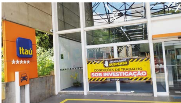
Na avaliação do Sindicato, danos na agência colocavam em risco a segurança dos bancários.

A agência só foi reaberta após reparos iniciais e compromisso de providências imediatas por parte do Banco.