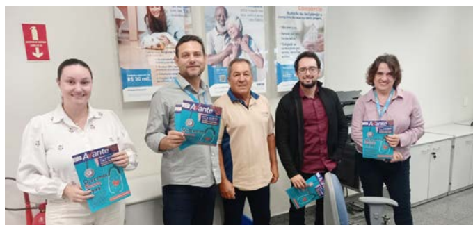
Visita às agências em Charqueada e distribuição de boletim sobre o plano.