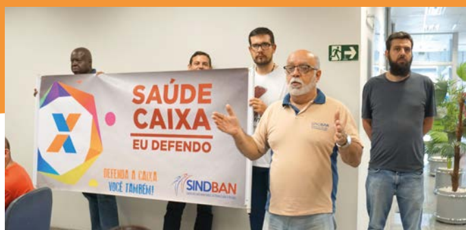
Diretores do SindBan presentes nas agências da CEF para discutir o acordo.

O movimento sindical continuará atento e manterá a luta pela derrubada do teto de 6,5% da folha de pagamentos para custeio da Caixa com a saúde dos trabalhadores, hoje previsto no Estatuto do banco.