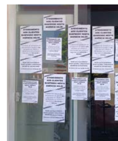
Cartazes informam aos clientes sobre os motivos da suspensão do atendimento.