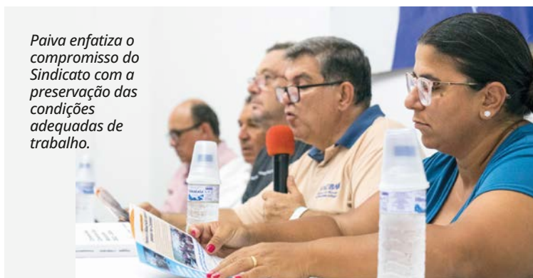
Paiva enfatiza o compromisso do Sindicato com a preservação das condições adequadas de trabalho.

Diante dos relatos, envolvendo vários bancos e agências, a plenária definiu intensificar as visitas e contatos com os bancários, para verificar as condições de trabalho, principalmente o ar-condicionado e segurança, e tomar medidas quando necessário.