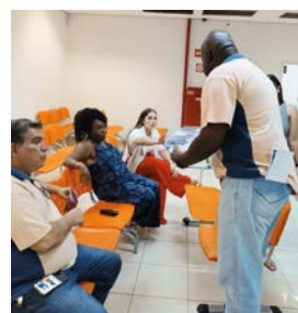
Diretores do Sindicato distribuíram informativo sobre Dia de Luta no Itaú contra demissões.

A situação da agência foi normalizada no dia 12 de dezembro, após o conserto dos equipamentos, com a garantia de condições de trabalho e funcionamento.