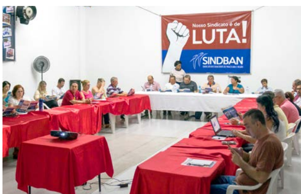
Diretores apresentam diagnóstico da situação de trabalho em todos os bancos e agências.

Entre os problemas nas agências, destaca-se a falta de manutenção nos equipamentos de ar-condicionado, o que tem ocasionado situações inadequadas de trabalho em virtude do aumento das temperaturas nessa época do ano.